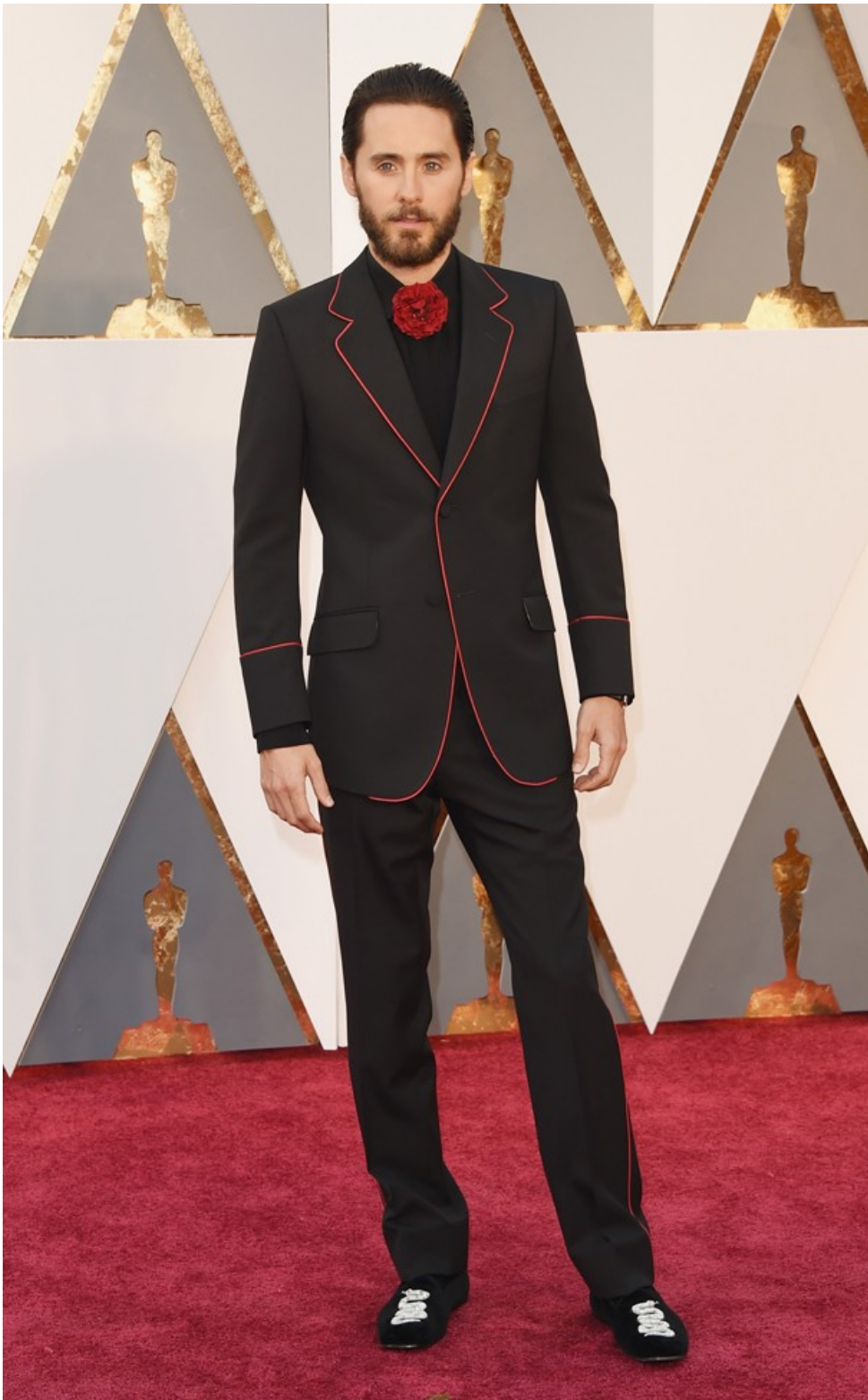
Jared Leto no Oscar 2016

Naomi Watts: Quando nessa vida Naomi erra? Nunca. Dessa vez não foi diferente com um Armani megabordado que seu marido escolheu. Awwwwn!