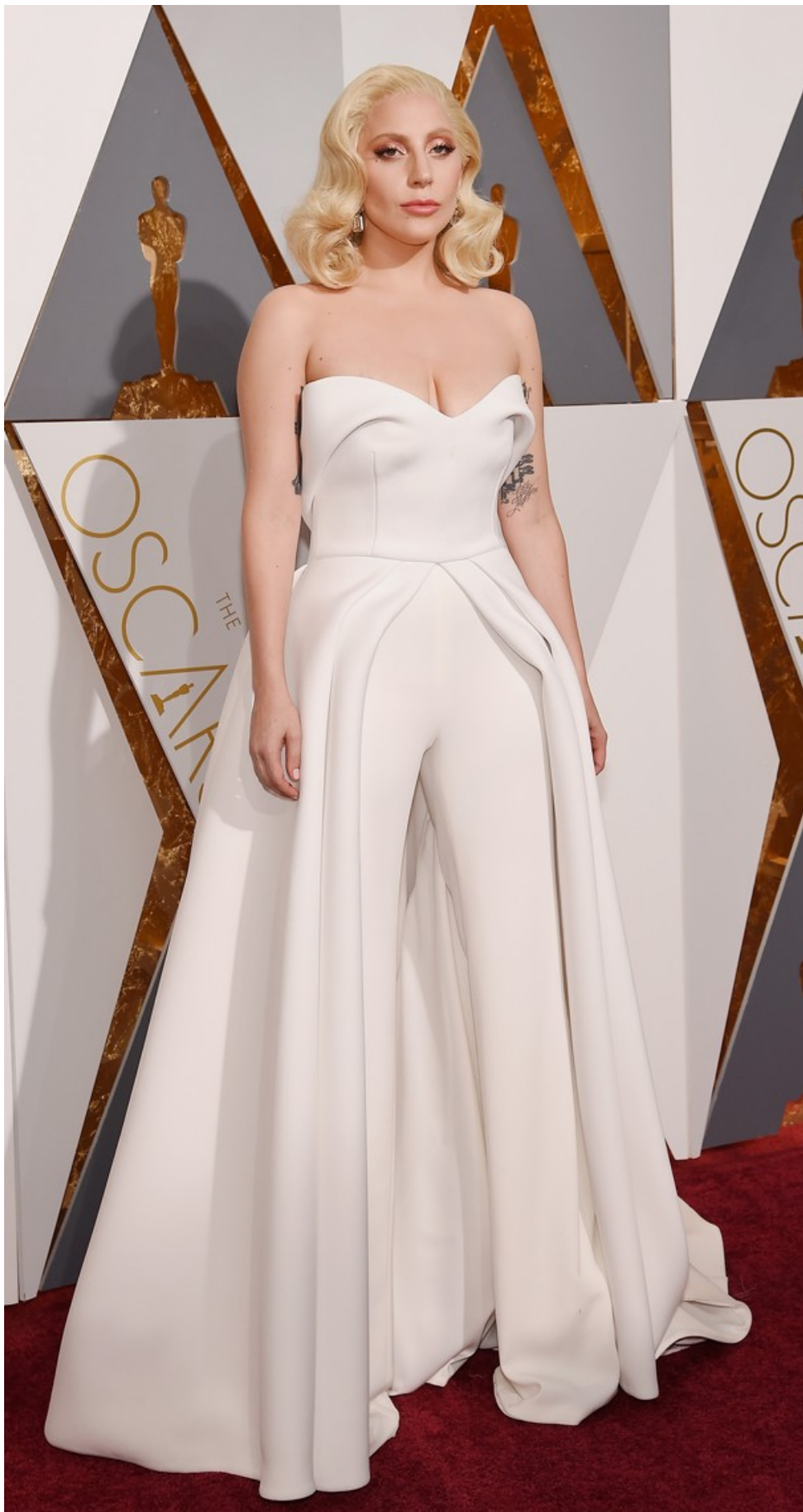
Lady Gaga no Oscar 2016

Alicia Vikander: A nova darling da Louis Vuitton obviamente escolheu a grife francesa pra vesti-la. E divou! Tudo bem que rolaram os memes dela sendo comprada com a Bela de "A Bela e a Fera", mas vimos isso como um elogio. Amamos Bela e amamos Alicia!