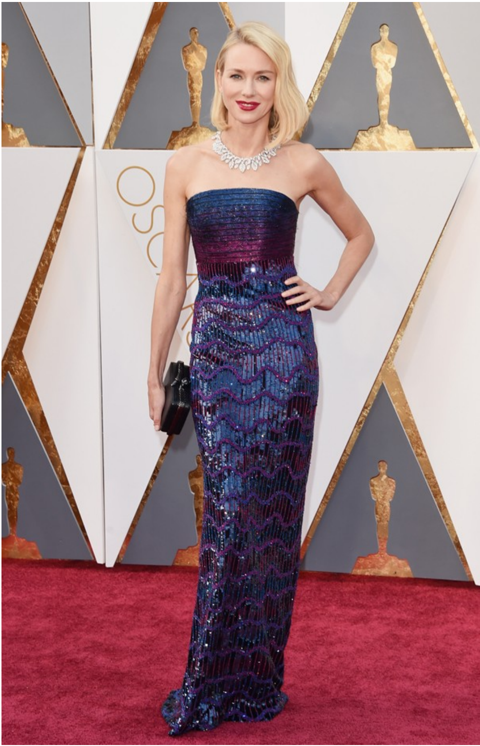
Naomi Watts no Oscar 2016