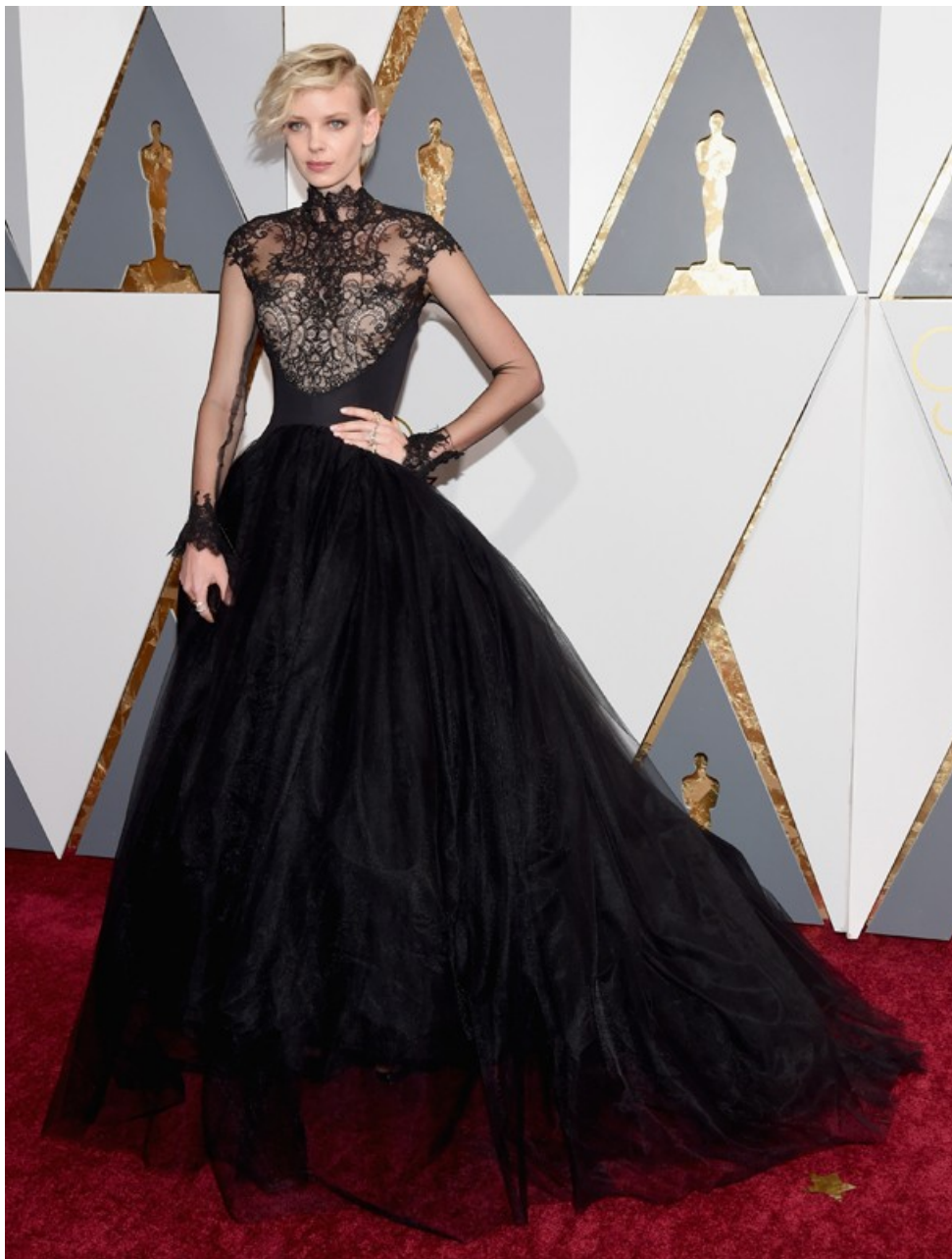
Dorith Mous no Oscar 2016