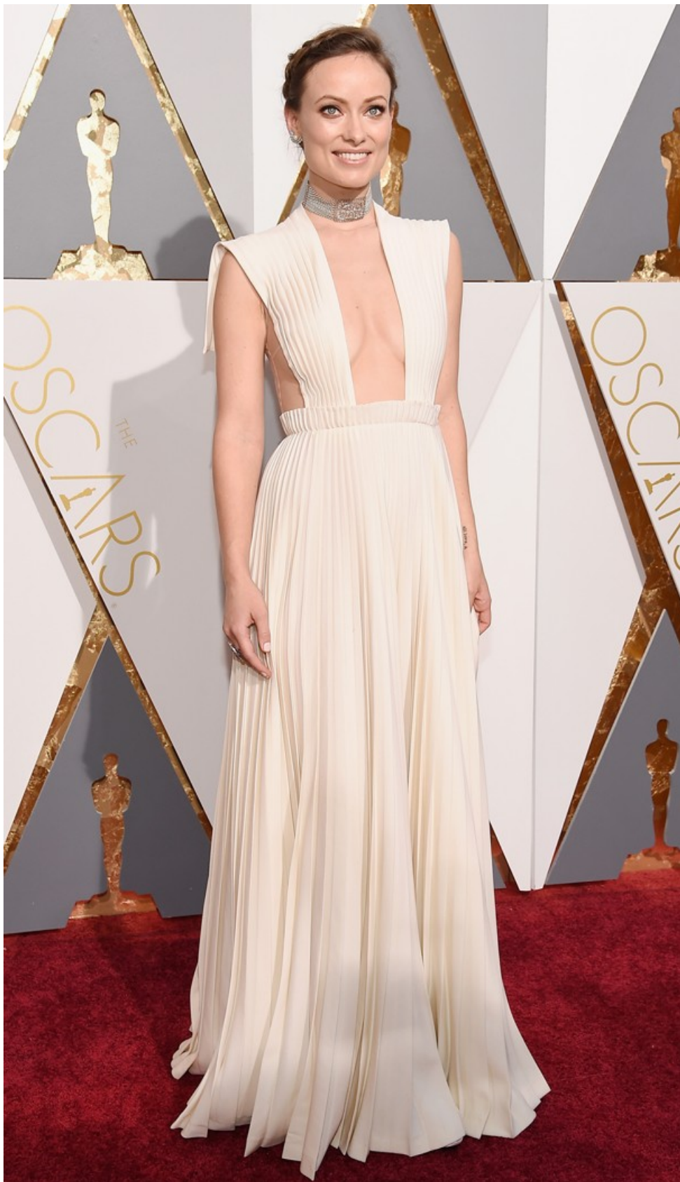
Olivia Wilde no Oscar 2016

Margot Robbie: A própria estatueta do Oscar, né? O DVF dourado deixou a loira ainda mais maravilhosa.