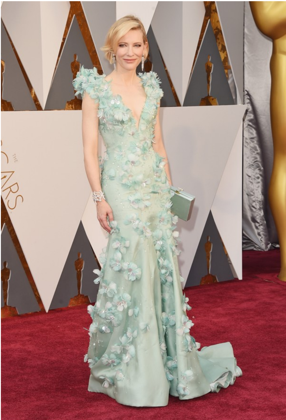
Cate Blanchett no Oscar 2016

Jared Leto: Ousadia e alegria. Tem homem mais original, cool e bem vestido?! Também achamos que não. Só Jared ficaria lindo e zero caricata com esse terno e gravata de flor. Bravo!