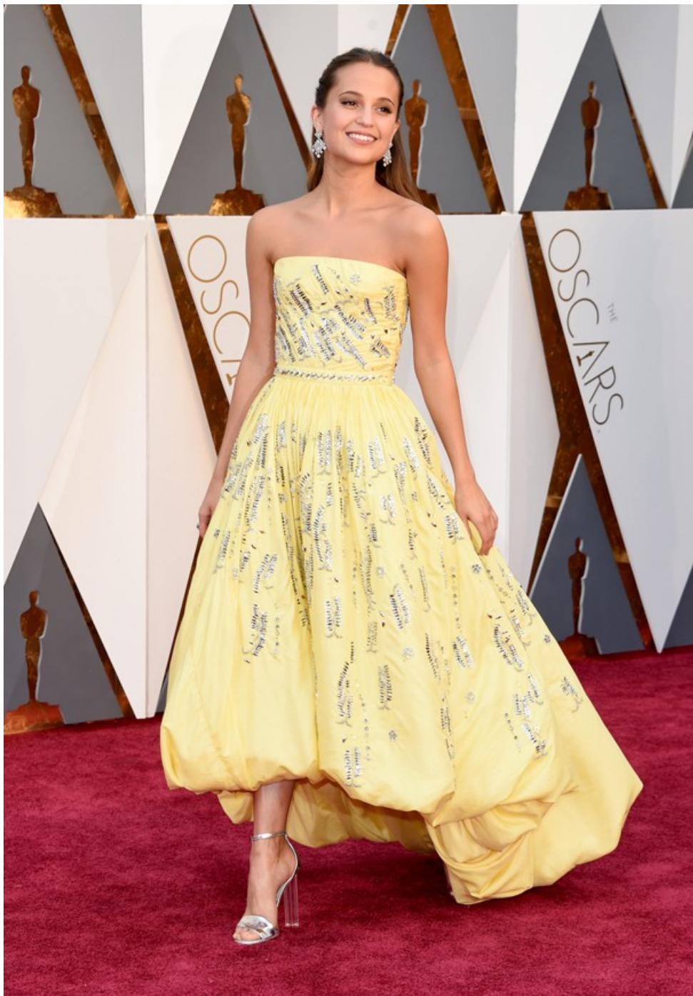
Alicia Vikander no Oscar 2016

Olivia Wilde: Se Marilyn Monroe fosse repetir a cena do vestido branco esvoaçante, certamente seria com o Valentino de Olivia. E esse decote? Será que ela usou o segredinho de Kim Kardashian pra levantar os seios ou é naturalmente uma felizarda?