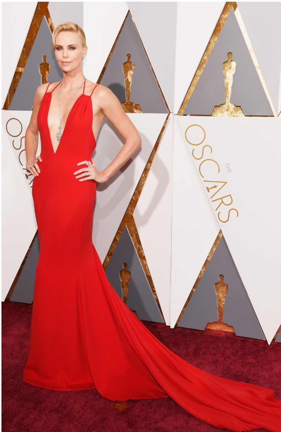
Charlize Theron no Oscar 2016

J.Law: Chegou por último e triunfante no preto sobre nude rendado Dior, hein?