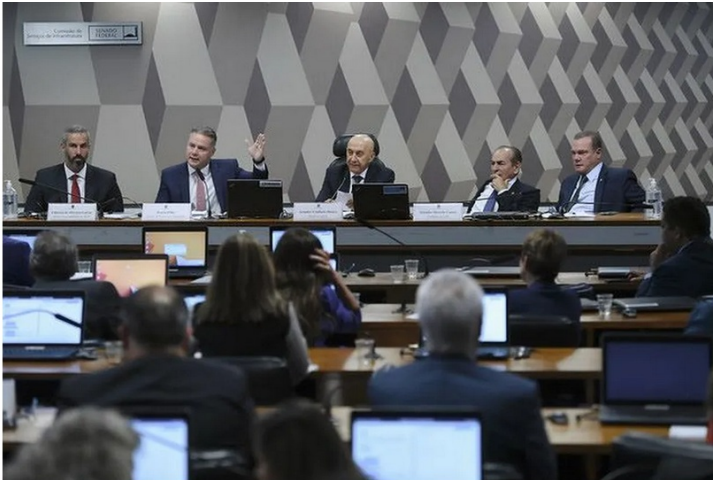
Comissão de Infraestrutura do Senado

O orçamento destinado a rodovias de Rondônia vai quadruplicar neste ano. A informação veio diretamente do Ministro dos Transportes, Renan Filho (MDB-AL), durante audiência pública nesta terça-feira (21) na Comissão de Comissões de Infraestrutura e Desenvolvimento Regional e da Comissão de Desenvolvimento Regional e Turismo do Senado Federal.