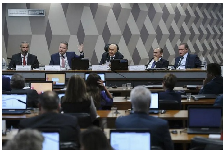
Comissão de Infraestrutura do Senado

O orçamento destinado a rodovias de Rondônia vai quadruplicar neste ano. A informação veio diretamente do Ministro dos Transportes, Renan Filho (MDB-AL), durante audiência pública nesta terça-feira (21) na Comissão de Comissões de Infraestrutura e Desenvolvimento Regional e da Comissão de Desenvolvimento Regional e Turismo do Senado Federal.